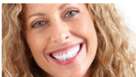
ligne du sourire haute ou gingivale

— “ Il existe trois types de lignes du sourire : la basse, la moyenne ou la haute, également dite gingivale. ”